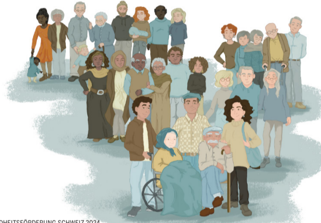
@GESUNDHEITSFÖRDERUNG SCHWEIZ 2024

sich miteinander lokal vernetzt, kann einander in schweren Situationen unterstützen. Wer voneinander und von hilfreichen Angeboten weiss, kann diese bei Bedarf schneller nutzen. Und man kann die eigenen Grenzen ansprechen, Erfahrungen austauschen und auch einfach zusammen sitzen und entspannen. Der Gottesdienst vom Sonntag, 2. März 2025 widmet sich speziell Betroffenen und ihren sich kümmernden Angehörigen. Er bietet eine Stärkung in belasteten Zeiten.